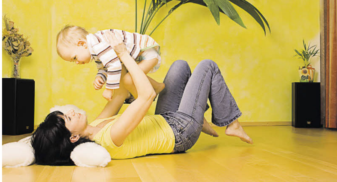
Fußbodenheizungen der neuen Generation sorgen bei niedriger Vorlauftemperatur und erstaunlich dünnem Aufbau für große Wirkung.

Tatsächlich spricht einiges gegen herkömmliche Heizkörper: Bei niedrigen Temperaturen geben Heizkörper kaum Energie ab. Hohe Temperaturen wirken sich schlecht auf den Wirkungsgrad des Heizsystems aus. Außerdem wird bei hohen Temperaturen die Raumluft umgewälzt und Staub aufgewirbelt. Durch das Vorbe-